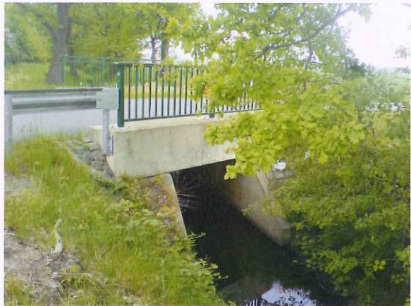
Abb. 4: Durchlassbauwerk ca. 600 m weiter südlich