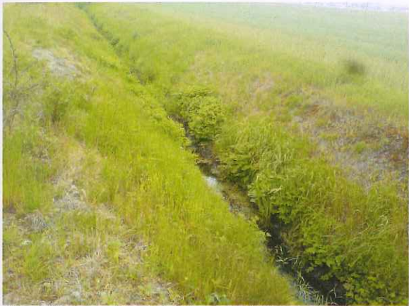
Abb. 3: Varrenbruchgraben auf Höhe der geplanten Querung