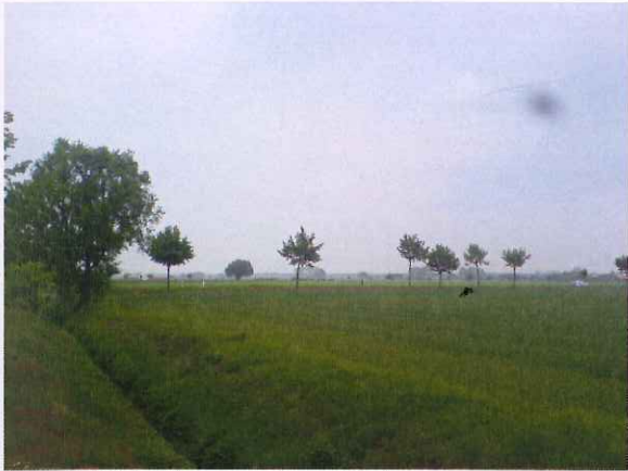
Abb. 1: Blick über das Plangebiet