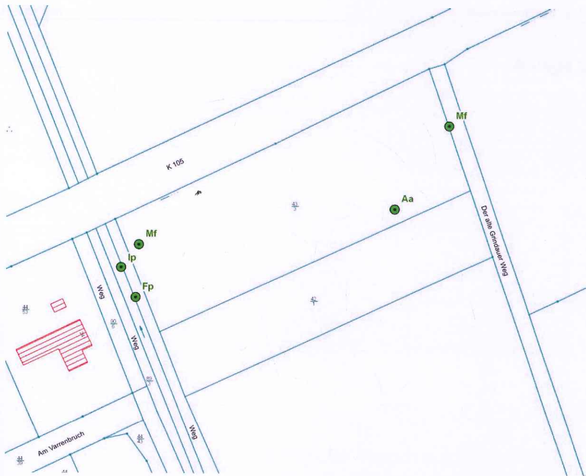
Abbildung 2: Kartenskizze mit artenschutzrechtlich relevanten Beobachtungen. Aa = Feldlerche ( Alauda arvensis ), Fp = Kahlrückige Waldameise ( Formica polyctena ), Ip = Wasser-Schwertlilie ( Iris pseudacorus ), Mf = Wiesen-Schafstelze ( Motacilla flava ).