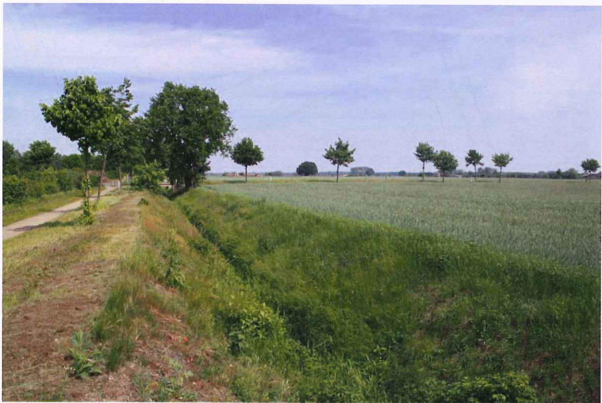
Abbildung 1: Blick entlang des Varrenbruchgrabens Richtung Norden. Rechts im Bild schließt sich der Getreideacker an. Im Hintergrund erkennbar sind die beiden älteren Eichen am östlichen Grabenrand.