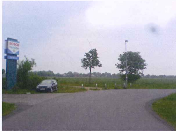
Abb. 2: Straße Am Varrenbruch, Blickrichtung Osten